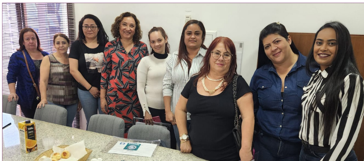
Participantes do curso

Sindilav potencializa o conhecimento das lavanderias promovendo curso de excelência em atendimento.