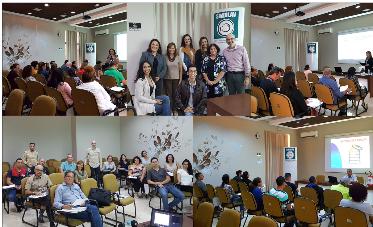
Cursos realizados em 2019

Sindilav inicia 2019 com vários cursos já realizados.