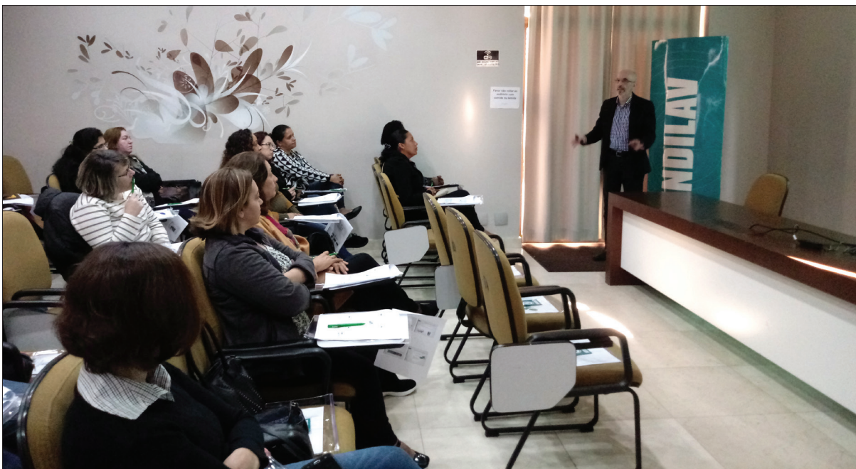
Workshop de produtividade e qualidade

Atividade faz parte da agenda anual de cursos do Sindilav.