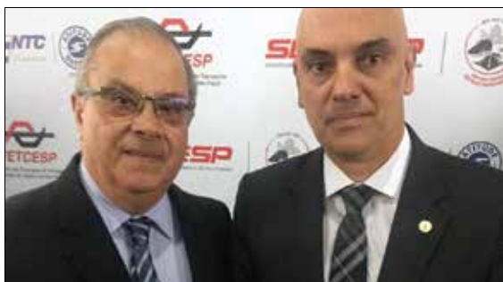
José Carlos Larocca e o ministro Alexandre de Moraes

A relação entre Larocca e o ministro teve início quando Alexandre de Moraes atuou como secretário de transporte do município de São Paulo. Ambos integraram a Comissão para Análise da Excepcionalidade na Zona de Máxima Restrição de Circulação (ZMRC), cuja exceção para tráfego nas áreas restritas beneficia as lavanderias hospitalares.