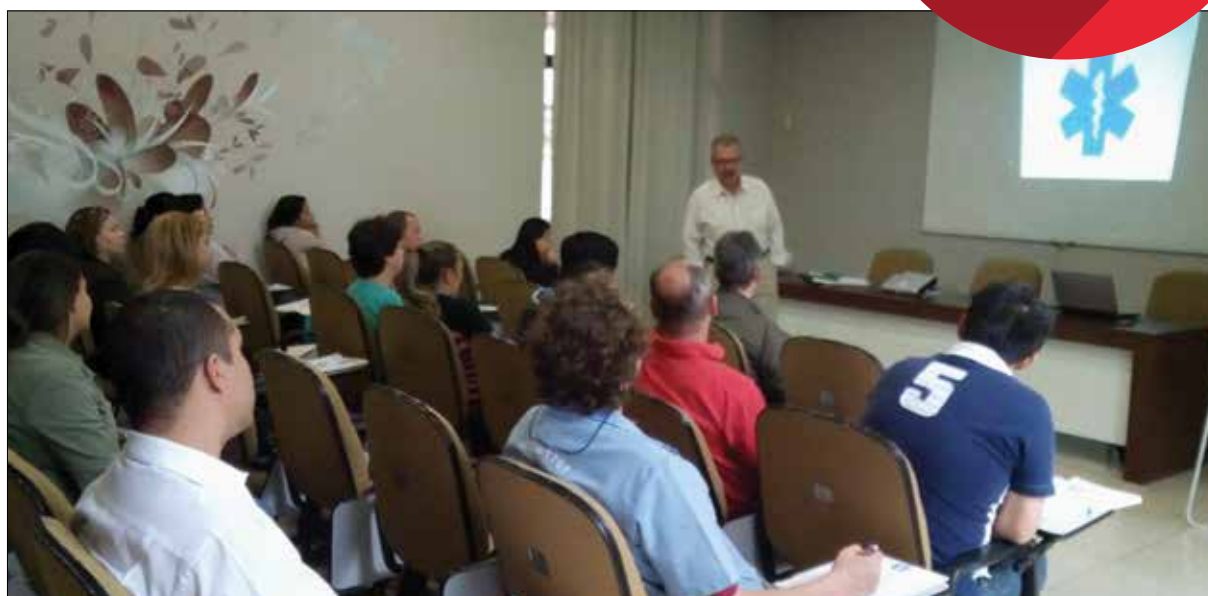
Participantes do curso "Primeiros Socorros"

Entre as atribuições do Sindilav está a de contribuir para a capacitação profissional de seus associados e equipes. Tanto que a agenda anual, disponibilizada no site: www.sindilav.com.br , é sempre divulgada no começo do primeiro semestre e seguida à risca durante todo o ano. No dia 20 de agosto, por exemplo, o sindicato realizou o curso " Primeiros Socorros ", que é obrigatório, de acordo com a Norma Regulamentadora nº 7 - item 7.5.1. Veja o que ela diz: